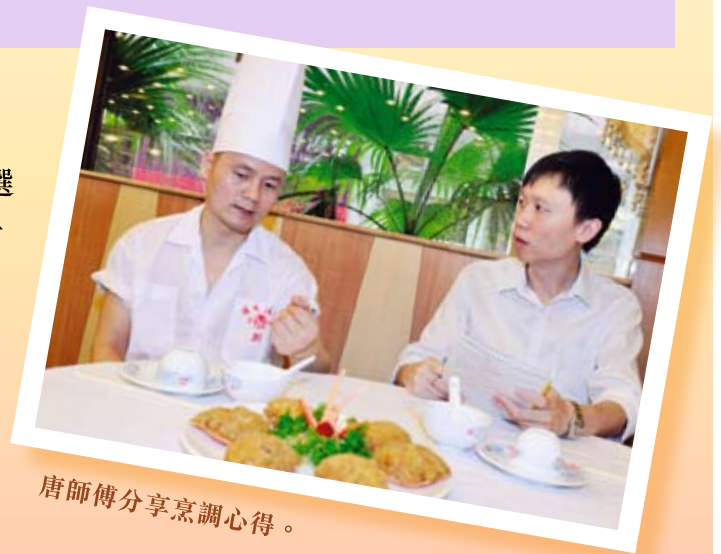
唐師傅分享烹調心得。

「食物安全『誠』諾」承諾人鳳城酒家一直履行食物安全責任，除製作高質素以及衛生安全的食品給大眾外，亦與政府和市民攜手，推動食物安全。