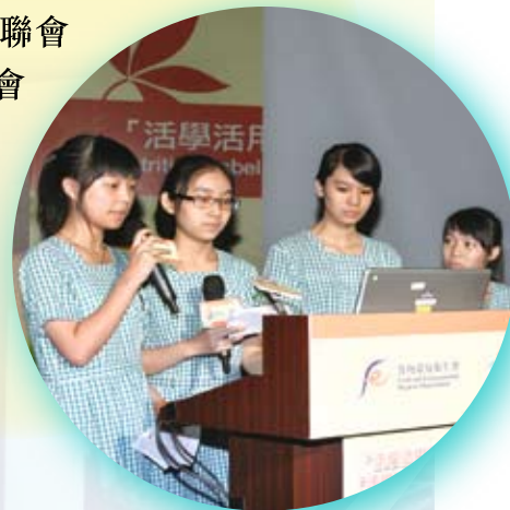
參加同學分享推廣活動中的得著和經驗。

除了著重年青社群，本中心亦放眼各社區團體。今年推行全新的「活用營養標籤繽紛購物獎勵計劃」，此計劃獲得香港社會服務聯會支持，合共有十八間社會服務機構參加。計劃一方面鼓勵社會服務機構的同工、小組領袖及義工舉辦營養標籤推廣活動，另一方面亦推動公眾透過社會服務機構的活動，活用營養標籤並填寫由中心提供的「我的購物日誌」，記錄日常運用營養標籤的情況。