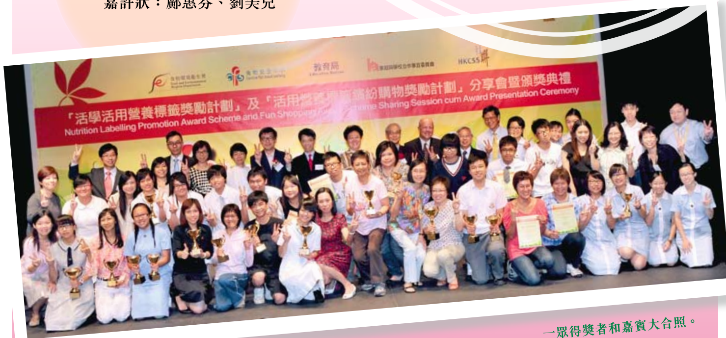
一眾得獎者和嘉賓大合照。