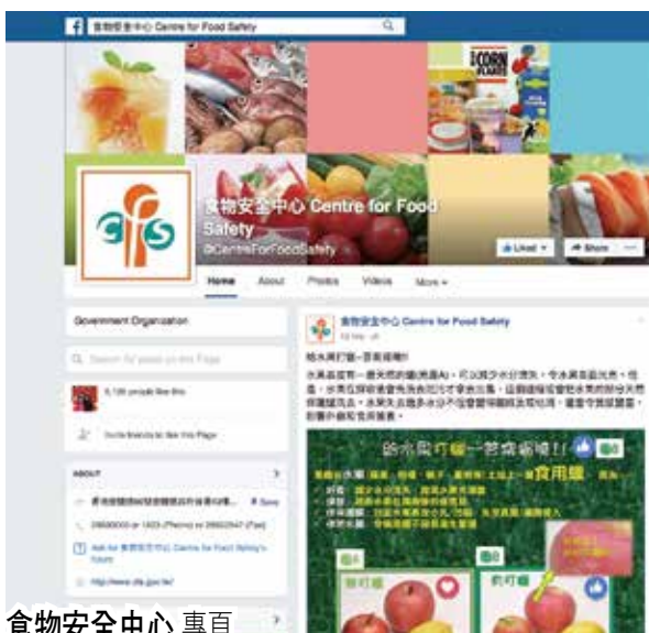
食物安全中心 專頁 https://www.facebook.com/CentreForFoodSafety

對於大部分的香港人來說，瀏覽 Facebook 已經成為每日的指定動作。不論你喜歡在 Facebook 留意好友的動向，還是貼文分享自己的生活，你也可以在食物安全中心的 Facebook 專頁，找到你最關注的食物安全資訊，包括食物警報、食物安全報告、食物安全貼士、專題研究報告和中心出版的刊物。中心並會上載有關食物安全的宣傳短片、中心活動花絮，以及講座和工作坊的資料，讓你掌握中心的最新消息。歡迎你隨時到食物安全中心 Facebook 專頁讚好及分享！