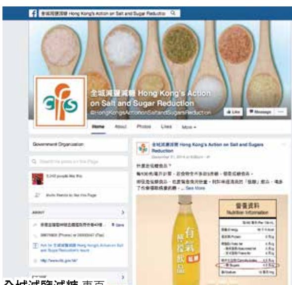
全城減鹽減糖 專頁 https://www.facebook.com/HongKongsActiononSaltandSugarsReduction

對於大部分的香港人來說，瀏覽 Facebook 已經成為每日的指定動作。不論你喜歡在 Facebook 留意好友的動向，還是貼文分享自己的生活，你也可以在食物安全中心的 Facebook 專頁，找到你最關注的食物安全資訊，包括食物警報、食物安全報告、食物安全貼士、專題研究報告和中心出版的刊物。中心並會上載有關食物安全的宣傳短片、中心活動花絮，以及講座和工作坊的資料，讓你掌握中心的最新消息。歡迎你隨時到食物安全中心 Facebook 專頁讚好及分享！