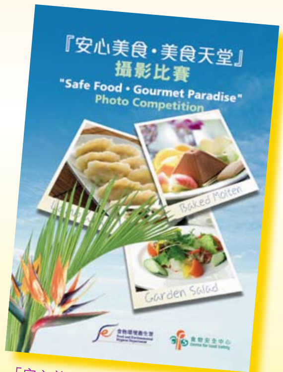
「安心美食·美食天堂」攝影比賽以另一角度推廣食物安全

中心年內安排了一連串食物安全推廣活動，包括於五月二十六日舉行「食物安全日2012」活動，向市民宣傳以正確溫度製作和貯存食物，及舉辦攝影比賽，透過鏡頭捕捉影像，展現香港「安心美食·美食天堂」的主題。