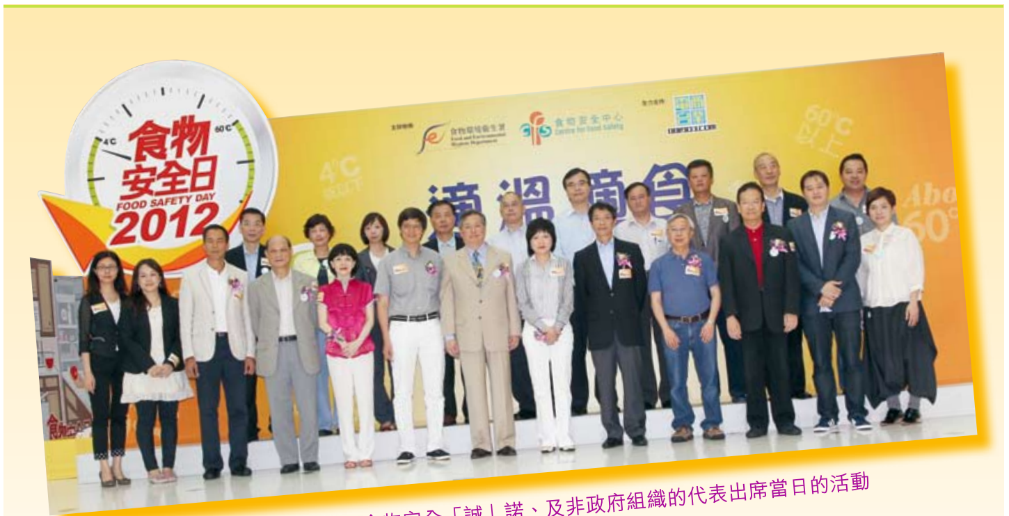
一眾來自食物業協會、食物安全「誠」諾、及非政府組織的代表出席當日的活動

正確溫度是確保食物安全的關鍵，因此，向市民推廣此信息極為重要。食物安全中心本年度的「食物安全日」主題為「適溫適食」，旨在宣傳以正確溫度貯存食物，確保食物安全。中心邀請到簽署食物安全「誠」諾的食物業界代表參與，表揚他們對食物安全「誠」諾的支持。