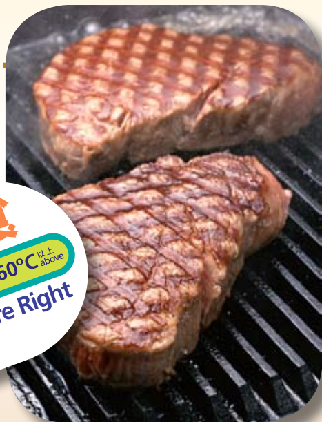
生的食物要徹底煮熟才可食用