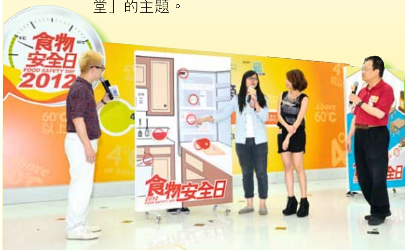
現場觀眾熱烈參與食物安全遊戲

中心亦於五月至八月期間，舉行多場公眾講座，講解食物安全的議題，包括適溫適食、善用營養標籤、踢走食物中的異物，以及食物事故及風險認知。