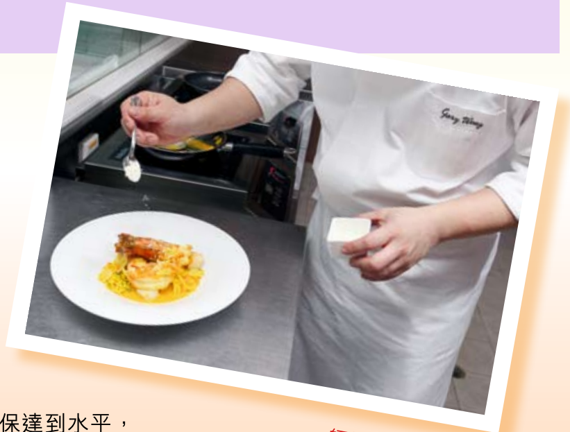
師傅講解烹調秘訣

日航酒店對於保障食物安全不遺餘力，自2009年起連續三年簽署「食物安全『誠』諾」，肩負起承諾人的使命，與政府攜手合作，向各界推廣食物安全。